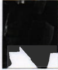
Perfectly balanced liquid and solid waste containers