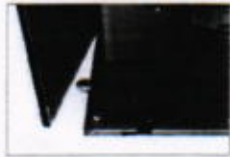
New system ensures top panel is not left open after ingredients filling