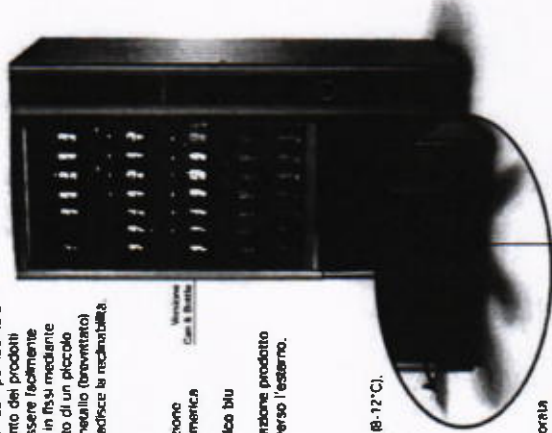
Modulazione Can & Bottle