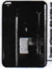
Design inclinabile della vetrina.