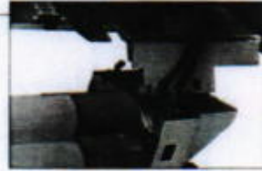
Easy internal access, even when jammed, due to the 180° opening of the cup funnel with double hinge