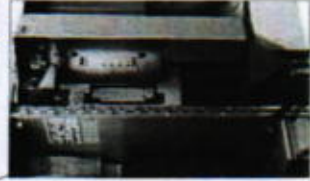
Protected compartment for payment systems. Coin mech or validator can be fitted together with a cashless system.